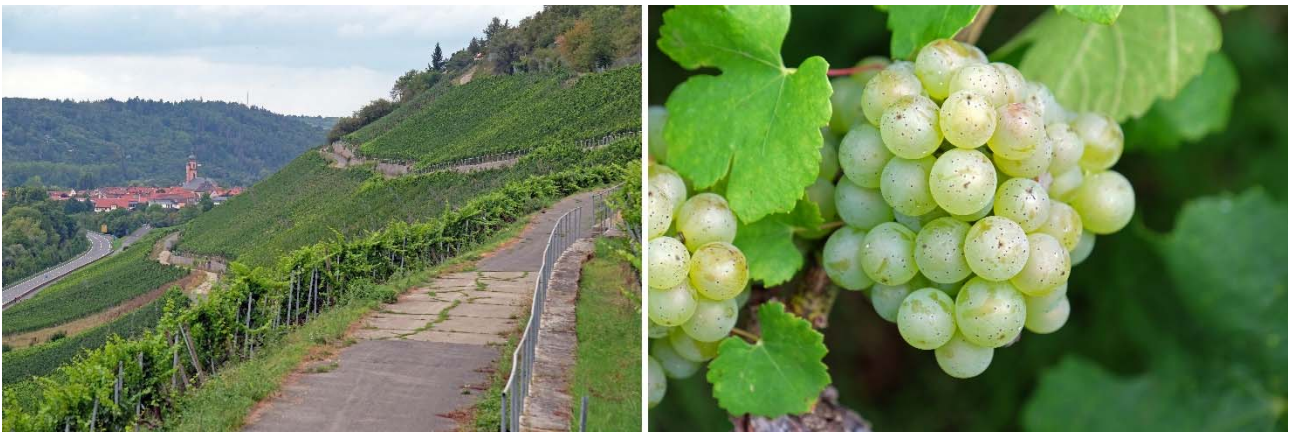
Im steilen Sommerhäuser Steinbach; perfekt gereifte Silvaner-Traube im Steinbach.